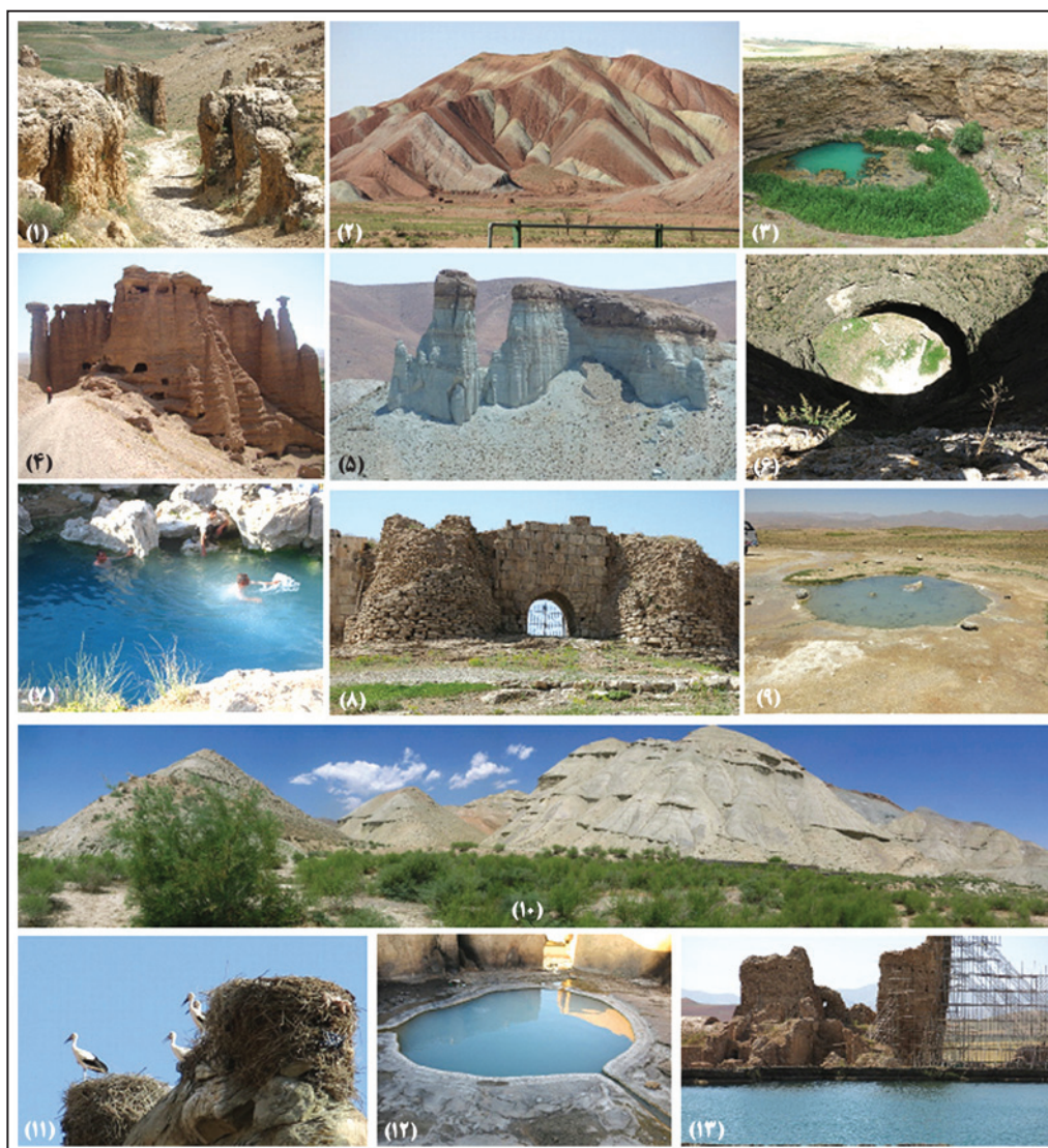
شکل ۱- نمونه‌ای از میراث زمین‌شناختی منطقه مورد مطالعه: (۱) شکل‌های فرسایشی بدرلو؛ (۲) سازندهای رنگی شکورچی؛ (۳) زندان نبی‌کندی؛ (۴) قلعه بهستان؛ (۵) شکل‌های فرسایشی؛ (۶) زندان سلیمان؛ (۷) چشمه آب گرم گوگردی قینرجه؛ (۸) میراث جهانی تخت سلیمان؛ (۹) چشمه آب گرم احمدآباد علیا؛ (۱۰) شکل‌های فرسایشی؛ (۱۱) قلعه لکنک‌ها؛ (۱۲) چشمه آب گرم احمدآباد علیا؛ (۱۳) میراث جهانی تخت سلیمان.